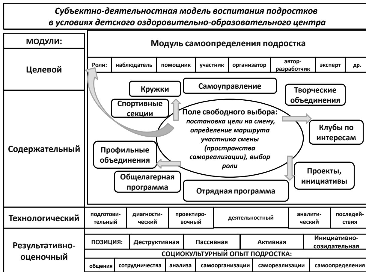
Рис. 1. Субъектно-деятельностная модель воспитания подростков в условиях детского оздоровительно-образовательного центра

Программа педагогического эксперимента, направленного на апробацию субъектно-деятельностной модели воспитания подростков в детском оздоровительно-образовательном центре и механизмов индивидуализации воспитательного процесса, включала в себя констатирующий и формирующий этапы.