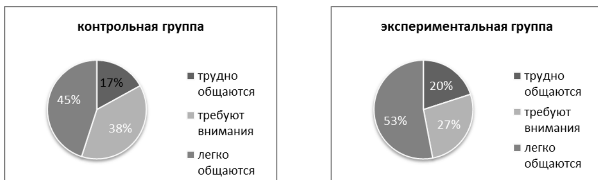
Рис. 4. Особенности общения с учителем

В ходе констатирующего эксперимента по формуле \chi^2 Пирсона на начальном этапе обучения среди первоклассников из разных формализованных групп существенных различий не установлено.