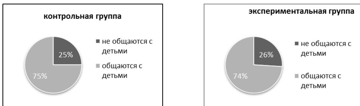
Рис. 3. Особенности общения с детьми